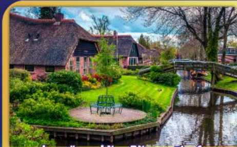
ล่องเรือหมู่บ้านไรกนทึร์รุ่น