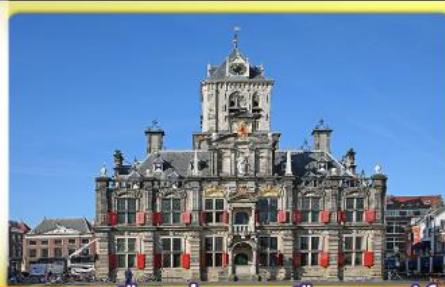
อาคารเมืองเก่าคลองเมืองเคลฟท์