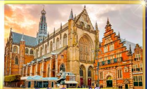
จัตุรัสเมืองฮาร์เล็ม

พรมแดนเมืองแปลกเนเธอร์แลนด์และเบลเยียม เดินเมืองเคลฟท์ เมืองเครื่องปั้นดินเผาระดับโลก ฮาร์เล็มเมืองมั่งคั่งที่สุดของเนเธอร์แลนด์