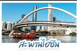
สะพานฮอซัน

บิตรงดวงใจ • จัดเต็มเที่ยวสวนสนุกกลางหลงเต็มวัน เที่ยวจีนฟีลยุโรป ชมสถาปัตยกรรม ณ เกาะซาเมียน สักการะวัดพระใหญ่ พุดรูปเก่าแก่กว่า 1,000 ปี ใจกลางเมืองกวางโจว เช็คอินกับแลนด์มาร์กสุดฮิตจตุรัสฮวาเจิมถ่ายรูปกับหอทีวี ช้อปปิ้งเพลิน ถนนคนเดินอีโต้และถนนคนเดินบักกิ่ง