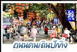
ถนนคนเดินบักกิ่ง