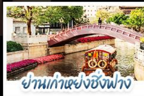
ย่านเก่าเซ่งซิงฟาง