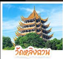
วัดเซคิงฉวน