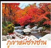
ภูเขาหมื่นชางซาน