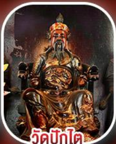
วัดปักไต้