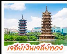
เจดีย์จินเจดีย์ทอง