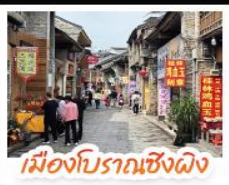
เมืองโบราณเซียงผิง

เขื่อนจุกไฮต์โลกกุ้ยหลิน เจดีย์นิมเจดีย์ทอง เวางวงช้าง นั่งเคเบิลคาร์สู่ เขาธู้อี้ จุดชมวิวทะเลภูเขา แห่งเมืองหยางชิว ล่องเรือแม่น้ำลิวเจียง ตามรอยช้างหลังภาพพระนบิตร์ 20 หยวน อิสระช้อปปิ้งถนนคนเดิน 2 แห่ง ถนนตงซีเซียง ถนนซีเจีย นั่งกระเช้าบอลลูนชมวิวกวาม 360 องศา