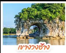
เวางวงช้าง