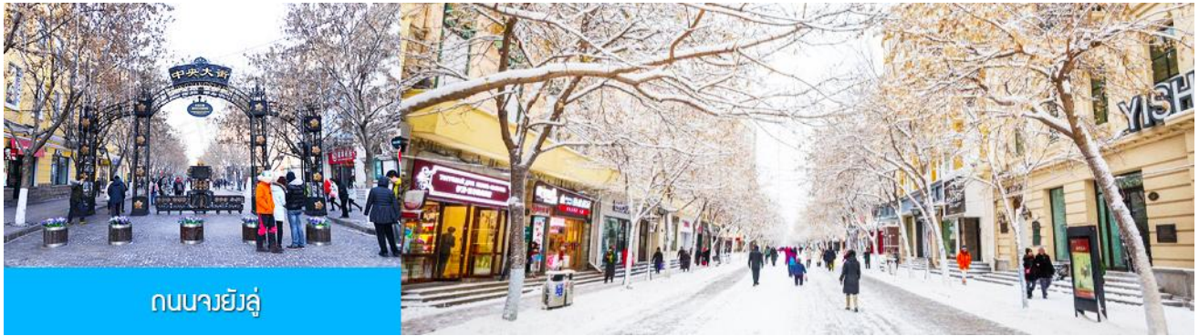
ถนนจงย้งถู

หลังอาหารนำท่านชม อนุสาวรีย์ฝงหวง 防洪纪念碑 อนุสรณ์ของชาวเมืองฮาร์บินที่ถูกจารึกในประวัติศาสตร์ ในการเอาชนะอุทกภัยธรรมชาติครั้งใหญ่ในปี ค.ศ. 1957