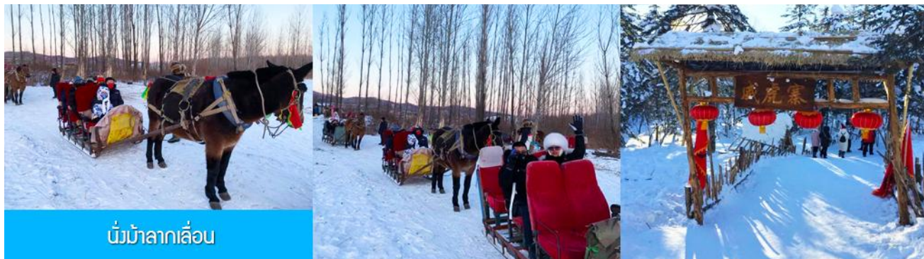
นั่งม้าลากเลื่อน

นำท่านสัมผัสประสบการณ์ นั่งม้าลากเลื่อน แล่นผ่านลานหิมะและแนวป่า 馬拉雪橇 (รวมในค่าทัวร์แล้ว)