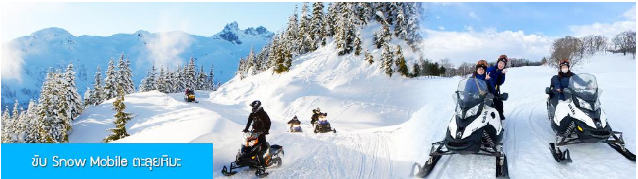
ขับ Snow Mobile ตะลุยหิมะ

ไกด์ท้องถิ่นนำเสนอโปรแกรมเสริม หรือ OPTIONAL TOUR ให้ท่านเลือกตามความสมัครใจ