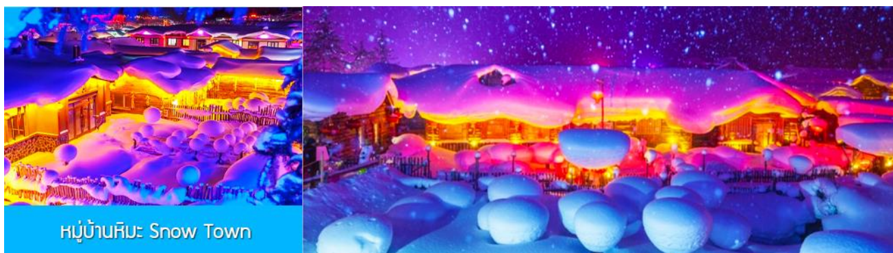
หมู่บ้านหิมะ Snow Town

ท่ามกลางท้องทุ่งและผืนป่าที่ปกคลุมด้วยหิมะราวกับอยู่ในโลกแห่งเทพนิยาย ผ่านหมู่บ้าน เว่ยหูจ้าย 威虎寨 ที่อดีตเคยเป็นที่ตั้งของรังโจรที่มักออกปล้นสะดมชาวบ้าน ม้าลากเลื่อนเป็นยานพาหนะเฉพาะพื้นที่ ๆ ที่นิยมนำมาใช้ในการเดินทางหรือลำเลียงสิ่งของในช่วงฤดูหนาว ที่ใช้ม้าลากจูงแคร่เลื่อนให้สามารถเคลื่อนย้ายบนลานหิมะได้