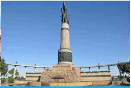
อนุสาวรีย์ฟิงหวง

วันที่ห้า เมืองฮาร์บิน – ถนนซิโน-บารอค-โบสถ์โซเฟีย-อนุสาวรีย์ป้องกันอุทกภัย-อิสระช้อปปิ้งย่านถนนจงยาง-สนามบิณฮาร์บิน