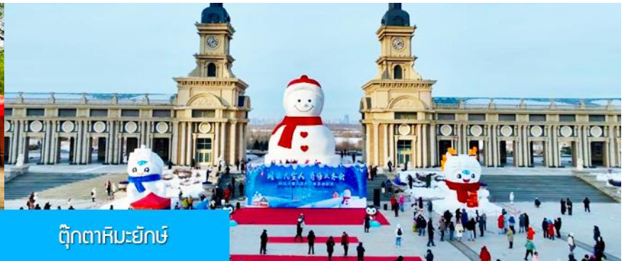
ตุ๊กตาหิมะยักษ์

เที่ยง รับประทานอาหารกลางวัน ณ ภัตตาคาร (8)