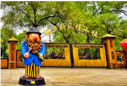
หมู่บ้านรัสเซีย

หลังอาหารนำท่านเดินทางโดยรถบัสสู่ เมืองฮาร์บิน (ระยะทาง 138 กม.ใช้เวลาเดินทางราว 2 ชั่วโมง) นำท่าน นั่งกระเช้าชมความสวยงามของแม่น้ำชวงฮวาเจียงในฤดูหนาว 乘缆车跨越松花江 แม่น้ำสายหลักที่ไหลผ่านเมืองฮาร์บิน ในช่วงฤดูหนาวน้ำในแม่น้ำชวงฮวาจะกลายเป็นลานน้ำแข็งขนาดใหญ่และปกคลุมด้วยหิมะ ชม หมู่บ้านรัสเซีย 俄罗斯小镇 ชมบ้านเรือนและริสอร์ทสไตล์รัสเซียรวม 27 หลังภายในหมู่บ้านเล็ก ๆ แห่งนี้ ตั้งอยู่บนเกาะพระอาทิตย์ 位于太阳岛上 เมื่อนักท่องเที่ยวมาเยือนในหมู่บ้านเสมือนท่านกำลังเดินเล่นอยู่ในหมู่บ้านหนึ่งใน รัสเซีย