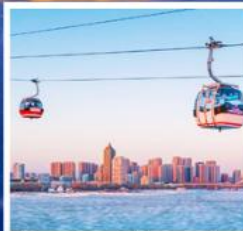
นั่งกระเช้าชมแม่น้ำของฮาร์เบียง