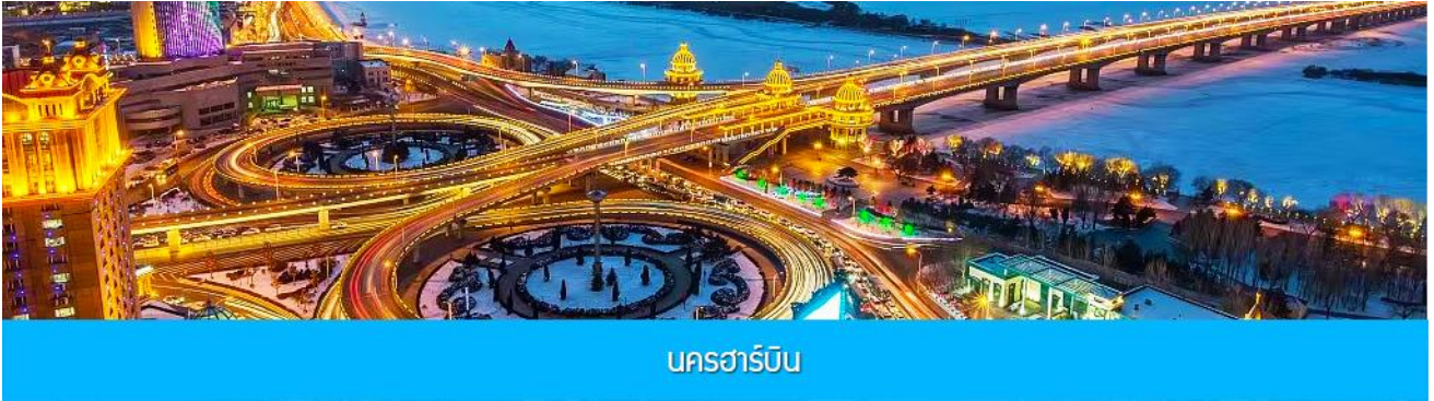
นครฮาร์บิน