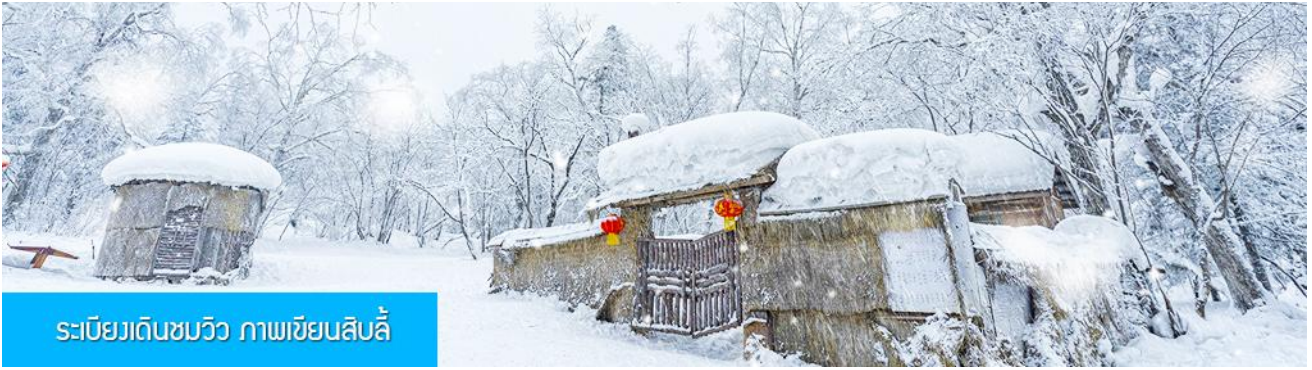
ระเบียบวเดินชมวิว ภาพเขียนสิบลี่

นำท่าน เที่ยวชมระเบียบวชมวิวภาพเขียนสิบลี่ 冰雪十里画廊 (รวมค่าบัตรเข้าชมแล้ว) เป็นการเดินชมวิ ธรรมชาติตามเนินเขา ท่ามกลางแนวป่าที่มีต้นไม้ที่มีน้ำแข็งเกาะอยู่ตามกิ่งไม้ ภูเขาทั้งลูกถูกห่อหุ้มด้วยหิมะขาวฟู เป็นภาพวิธรรมชาติดูหนาวที่สวยงามน่าประทับใจและพบได้เฉพาะในฤดูหนาวทางภาคอีสานของจีนเท่านั้น เวลาที่ใช้สำหรับโปรแกรมเสริมนี้ประมาณ 1 ชั่วโมงครึ่ง