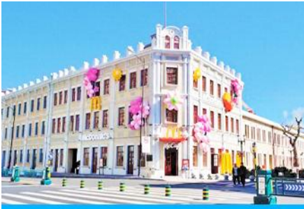
ถนนซิโนบารอค