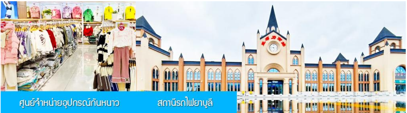
ศูนย์จำหน่ายอุปกรณ์กันหนาว

หมายเหตุ เพื่อความสะดวกในการเข้าพักใน HOME STAY ภายในหมู่บ้านหิมะ ทางทัวร์แนะนำให้ท่านจัดเตรียมเสื้อผ้าและเครื่องใช้เท่าที่จำเป็น 1 ชุดใส่กระเป๋าใบเล็กหรือเป้แบบสพายได้ เพื่อสะดวกในการนำติดตัวไปใช้สำหรับคืนที่นอนในหมู่บ้านหิมะ เนื่องการนำกระเป๋าเดินทางใบใหญ่เข้าสู่ที่พักในหมู่บ้านอาจสร้างความไม่สะดวกแก่ท่าน