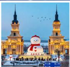
ตุ๊กตาหิมะยักษ์