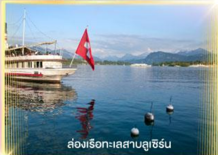
ล่องเรือทะเลสาบลูซิิร์น