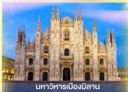
มหาวิหารเมืองมิลาน