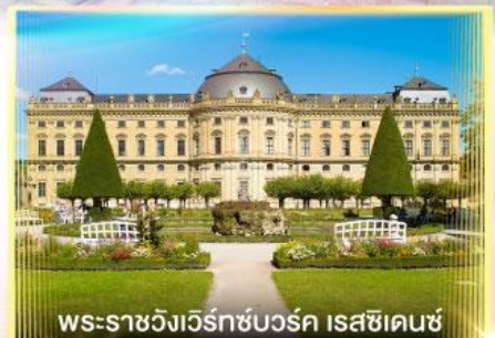
พระราชวังแวร์ซายส์ ไรชชิ่งเฮาส์