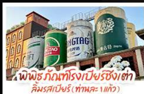
พิพิธภัณฑ์โรงเบียร์ชิงเต่า คิมรสเบียร์ (ท่าทะเล 1 แก้ว)