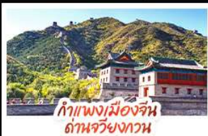
กำแพงเมืองจีน ด้านจวิ้นกวน

ล่องเรือสุดโรแมนติกแม่น้ำหวงหมู่ ปักกิ่ง..เปิดประตูแดนมังกร ด้วยความอลังการระดับจักรพรรดิ ชิงเต่า..เมืองชายทะเลสไตล์ยุโรป หอระฆังแบบย้อนเวลา เซี่ยงไฮ้..มหานครแห่งเอเชีย เมืองที่ไม่เคยหลับใหล