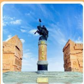
เขตท่องเที่ยวเจงกีสข่าน