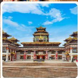
ทำเนียบพระลามะอูหลาน