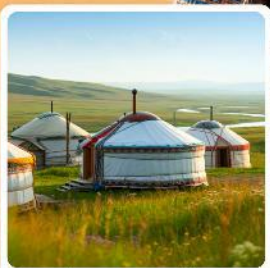
ที่พักแบบกระโจม