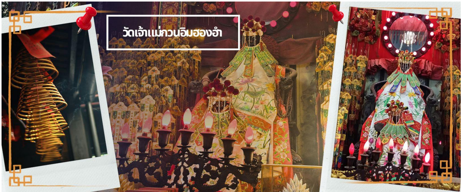
วัดเจ้าแม่กวนอิมสองอ้า

จากนั้นนำทุกท่านเดินทางสู่ วัดเจ้าแม่กวนอิมสองอ้า (HUNG HOM KWUN YUM TEMPLE) เป็นหนึ่งในวัดที่ชาวฮ่องกงนั้นเลื่อมใสกันมาก ด้วยความที่เจ้าแม่กวนอิมนั้นเป็นเทพเจ้าแห่งความเมตตา ฉะนั้นเมื่อใครมีทุกข์ร้อนอะไรก็มักจะมาราบไหว้ขอพรให้เจ้าแม่นั้นช่วยเหลือ วัดนี้ถูกสร้างขึ้นในปี ค.ศ.1873 ในช่วงสงครามโลกครั้งที่ 2 มีการปล่อยระเบิดลงบริเวณวัดสองอ้าหลายต่อหลายครั้ง ทำให้มีผู้บาดเจ็บและล้มตายมากมาย แต่ชาวบ้านที่หนีเข้าไปหลบ