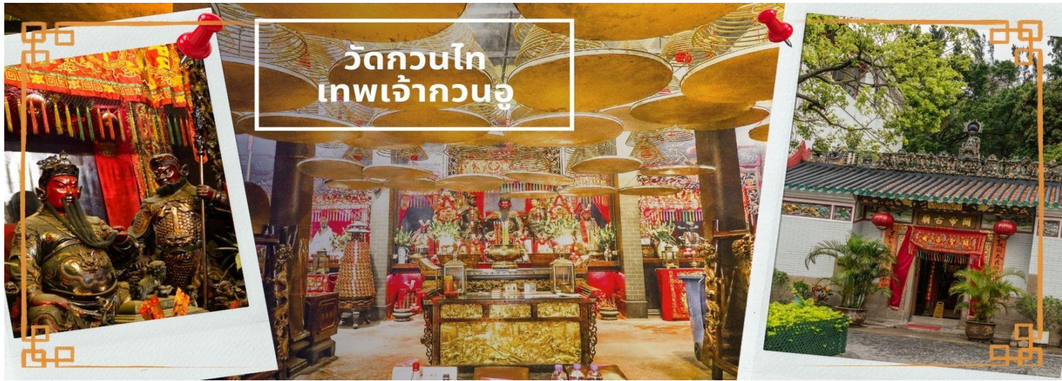
วัดกวนไท เทพเจ้ากวนอู

จากนั้นนำท่าน ไหว้ขอพรเรื่องเดินทาง การติดต่อ ค้าขาย วัดเจ้าแม่ทับทิมทินหัว (Tin Hau Temple) ที่ Yau Ma Tei เป็นวัดเก่าแก่ขนาดเล็ก อายุกว่า 150 ปี มีต้นกำเนิดมาจากวัดเล็กๆ ใน พื้นที่ตลาด Kwun Chung เคยเป็นหมู่บ้านชาวประมงมาก่อน ตั้งแต่ปี 1864 เป็นวัดที่อุทิศให้กับทินโหว่ (หมาโจ้ เทพเจ้าแห่งท้องทะเล) มีบรรยากาศที่สงบ ร่มรื่น ติดกับสวนสาธารณะเล็ก ๆ และนักท่องเที่ยวยังไม่พลุกพล่านมากจุดเด่นที่แนะนำคือ การปิดทองเรือมังกร เพื่อการทำงานการค้า ธุรกิจ ให้เจริญรุ่งเรือง