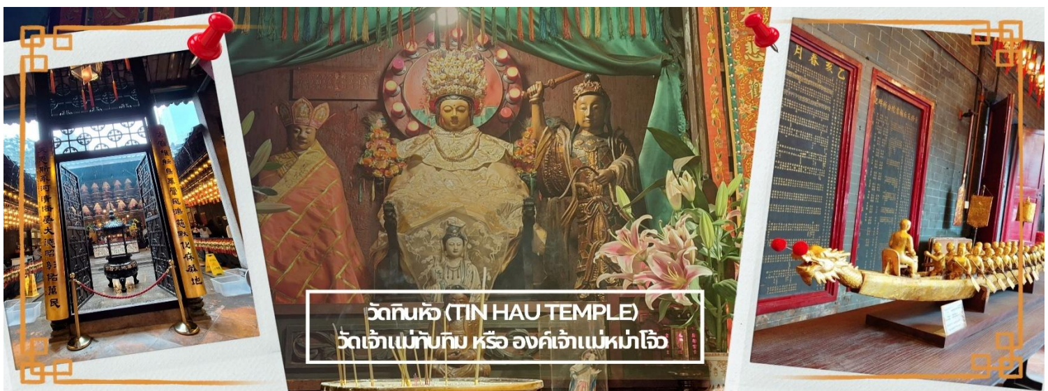
วัดกันหัว (TIN HAU TEMPLE) วัดเจ้าแม่ทับทิม หรือ องค์เจ้าแม่หมาโจ้

จากนั้นนำท่าน ไหว้ขอพรเรื่องเดินทาง การติดต่อ ค้าขาย วัดเจ้าแม่ทับทิมทินหัว (Tin Hau Temple) ที่ Yau Ma Tei เป็นวัดเก่าแก่ขนาดเล็ก อายุกว่า 150 ปี มีต้นกำเนิดมาจากวัดเล็กๆ ใน พื้นที่ตลาด Kwun Chung เคยเป็นหมู่บ้านชาวประมงมาก่อน ตั้งแต่ปี 1864 เป็นวัดที่อุทิศให้กับทินโหว่ (หมาโจ้ เทพเจ้าแห่งท้องทะเล) มีบรรยากาศที่สงบ ร่มรื่น ติดกับสวนสาธารณะเล็ก ๆ และนักท่องเที่ยวยังไม่พลุกพล่านมากจุดเด่นที่แนะนำคือ การปิดทองเรือมังกร เพื่อการทำงานการค้า ธุรกิจ ให้เจริญรุ่งเรือง