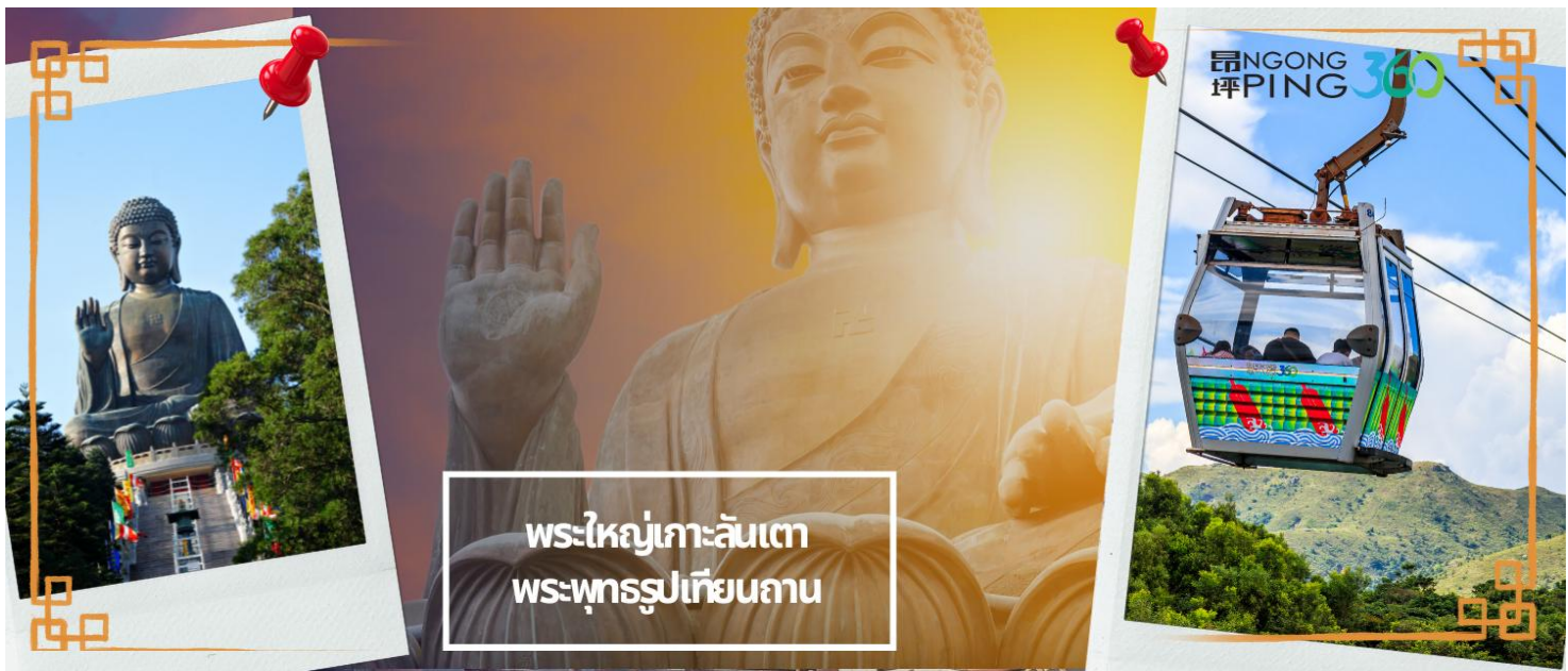
พระใหญ่เกาะลันเตา พระพุทธรูปเทียนถาน

อิสระบริการอาหารกลางวัน ตามอัธยาศัยเพื่อสะดวกในการท่องเที่ยว