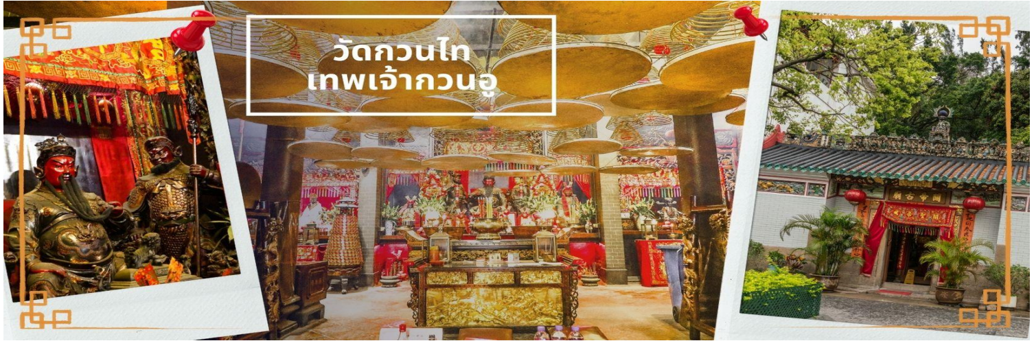
วัดกวนไท เทพเจ้ากวนอู

จากนั้นนำท่าน ไหว้ขอพรเรื่องเดินทาง การติดต่อ ค้าขาย วัดเจ้าแม่ทับทิมทินหัว (Tin Hau Temple) ที่ Yau Ma Tei เป็นวัดเก่าแก่ขนาดเล็ก อายุกว่า 150 ปี มีต้นกำเนิดมาจากวัดเล็กๆ ใน พื้นที่ตลาด Kwun Chung เคยเป็นหมู่บ้านชาวประมงมาก่อน ตั้งแต่ปี 1864 เป็นวัดที่อุทิศให้กับทินโหว่ (หมาจิ้งจอก เทพเจ้าแห่งท้องทะเล) มีบรรยากาศที่สงบ ร่มรื่น ติดกับสวนสาธารณะเล็ก ๆ และนักท่องเที่ยวยังไม่พรั่งพลามากจุดเด่นที่แนะนำคือ การปิดทองเรือมังกร เพื่อการงานการค้า ธุรกิจ ให้เจริญรุ่งเรือง