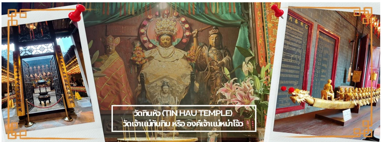
วัดทินหัว (TIN HAU TEMPLE) วัดเจ้าแม่ทับทิม หรือ องค์เจ้าแม่หม่าโจ้ว

จากนั้นนำท่าน ไหว้ขอพรเรื่องเดินทาง การติดต่อ ค้าขาย วัดเจ้าแม่ทับทิมทินหัว (Tin Hau Temple) ที่ Yau Ma Tei เป็นวัดเก่าแก่ขนาดเล็ก อายุกว่า 150 ปี มีต้นกำเนิดมาจากวัดเล็กๆ ใน พื้นที่ตลาด Kwun Chung เคยเป็นหมู่บ้านชาวประมงมาก่อน ตั้งแต่ปี 1864 เป็นวัดที่อุทิศให้กับทินโหว่ (หมาจิ้งจอก เทพเจ้าแห่งท้องทะเล) มีบรรยากาศที่สงบ ร่มรื่น ติดกับสวนสาธารณะเล็ก ๆ และนักท่องเที่ยวยังไม่พรั่งพลามากจุดเด่นที่แนะนำคือ การปิดทองเรือมังกร เพื่อการงานการค้า ธุรกิจ ให้เจริญรุ่งเรือง