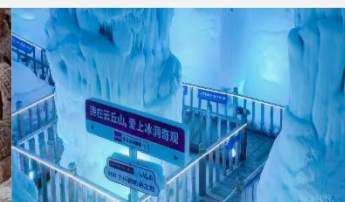
ถ้ำน้ำแข็งอวี่นชีวซาน

*ทางบริษัทฯ ขอสงวนสิทธิ์ในการสลับโปรแกรมทัวร์ตามความเหมาะสมขึ้นอยู่กับสถานการณ์หน้างาน โดยคำนึงถึงผลประโยชน์ของลูกค้าเป็นสำคัญ