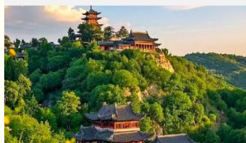
เขาเหยาหวังชาน