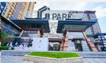
ห้าง G Park