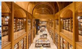
ห้องสมุด Fang Suo