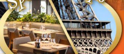
รับประทานอาหารกลางวัน บนหอคอยเฟลา

ไฮไลท์ในโปรแกรม • สะพานไมชาเปเล ลูเซิร์น