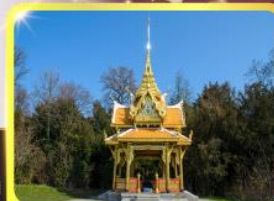
ศาลาไทยไชยาน์