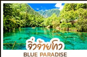
จิวจ้ายโกว BLUE PARADISE