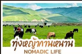
ทุ่งหญ้ากานหนาน NOMADIC LIFE