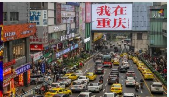
กวนอิมเจียว

*ทางบริษัทฯ ขอสงวนสิทธิ์ในการสลับโปรแกรมทัวร์ตามความเหมาะสมขึ้นอยู่กับสถานการณ์หน้างาน โดยคำนึงถึงผลประโยชน์ของลูกค้าเป็นสำคัญ