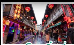
ถนนโบราณจินหลี่