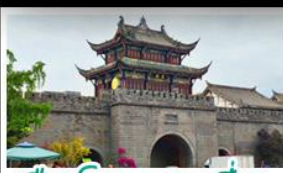
เมืองโบราณทวนเซี่ยน

ภูเขาสิ่วครุณี - อุทยานปู้ฝิงโกว - สะพานหนานเฉียว - ร้านหนังสือจงซูเก้อ - เมืองโบราณกวนเหลียน จตุรัสหยางเทียนหวู่ - หมีแพนด้าซาฟี่ - ถนนโบราณชอยกว้างชวยแคบ - ถนนคนเดินไท่กู่หลี่ ถนนคนเดินซุซซี่ - ถนนโบราณจินหลี่ - แพนด้ายักษ์ปิ่นตึก - บ้านฟูไบ่ไฟตึกSKP - วัดต้าเจ้อ