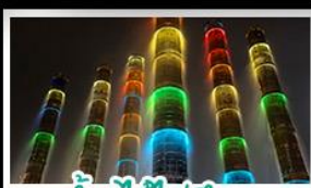
น้ำพุไม้ไฟตึกSKP