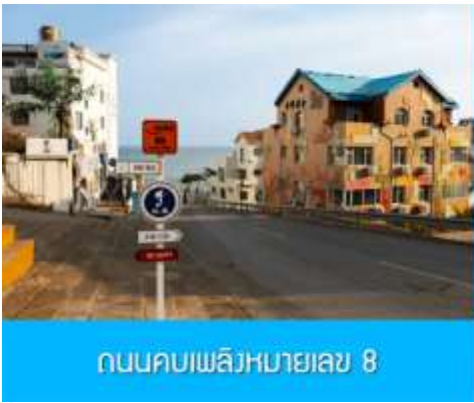
ถนนคอบเพลิงหมายเลข 8

นำท่านชมสวนสาธารณะเวย์ไห่ 威海公园 สวนสาธารณะริมทะเลที่ใหญ่ที่สุดของเมืองเวย์ไห่ ให้ท่านชมและถ่ายภาพคู่กับ กรอบรูปยักษ์วิวทะเล 威海公园大相框 แลนด์มาร์คที่เป็นอีกหนึ่งไฮท์ไลท์ฮิตของเมืองเวย์ไห่