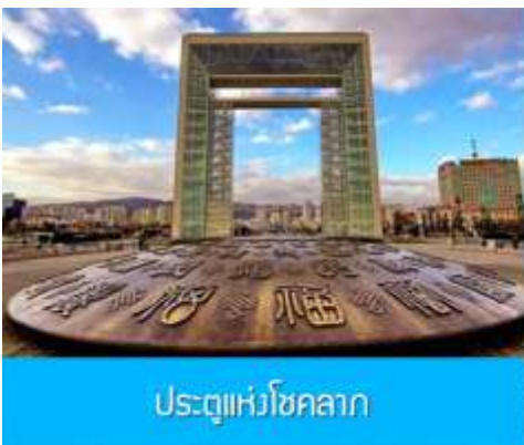
ประตูแห่งโชคกลาง