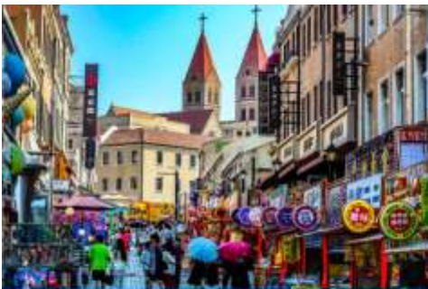
ถนนวาชาน