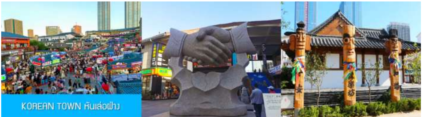
KOREAN TOWN หันเล่อฝาง