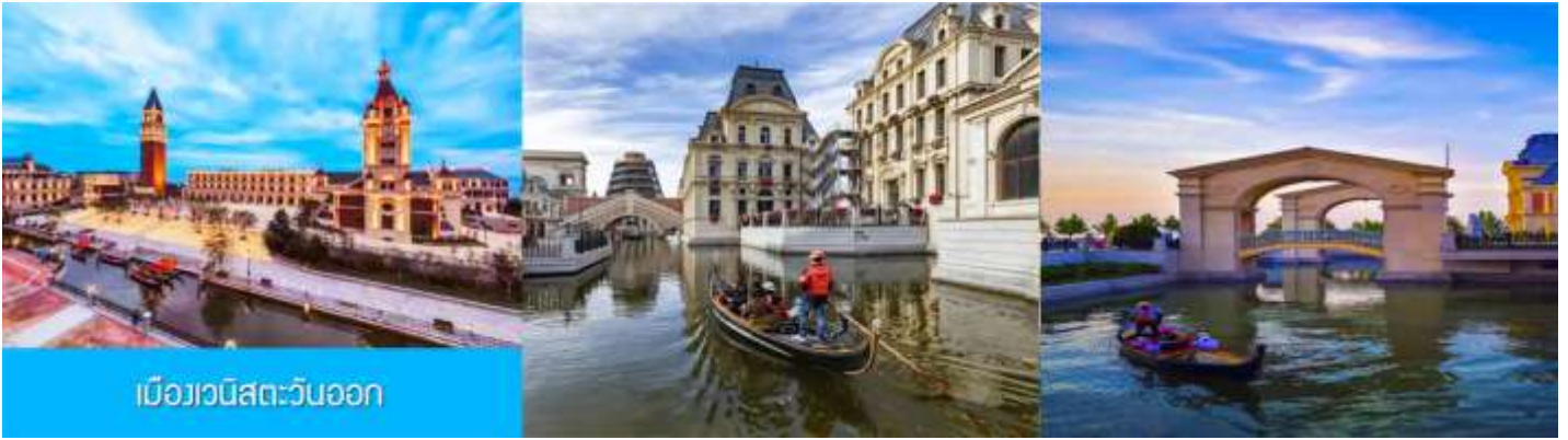
เมืองเวนิสตะวันออก