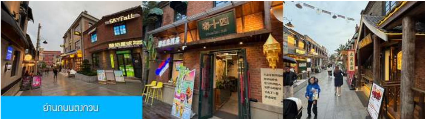
ย่านถนนตงกวน

หลังอาหารนำท่านเที่ยวชม จัตุรัสชิงไห่ 星海广场 เป็นจัตุรัสขนาดใหญ่เป็นแลนด์มาร์คสำคัญของเมืองต้าเหลียน สร้างขึ้นเพื่อเฉลิมฉลองในโอกาสที่รัฐบาลอังกฤษคืนเกาะฮ่องกงในให้จีนในปี ค.ศ. 1997 ตั้งอยู่ชายฝั่งทะเลในเมืองต้าเหลียน เป็นจัตุรัสใจกลางเมืองที่ใหญ่ที่สุดในโลกและ เป็นแลนด์มาร์คของเมืองต้าเหลียน รายล้อมด้วยตึกระฟ้าที่ทันสมัย ภายในมีบ่อน้ำพุดนตรี ลานหญ้าขนาดใหญ่ และลานกว้างสำหรับจัดกิจกรรมกลางแจ้ง อาทิ เทศกาลเบียร์นานาชาติ การแข่งขันวิ่งมาราธอน งานแฟชั่นนานาชาติเมืองต้าเหลียน ฯลฯ