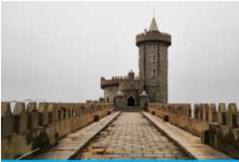
คาเฟ่อีสต