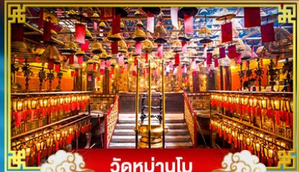
วัดมานโม

พักกลางวัน "จิมซาร์จ" ปีนหรือลองเทศกาลปีใหม่ ณ เกาะฮ่องกง