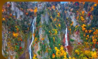
น้ำตกกิงกะ และน้ำตกริวเซ