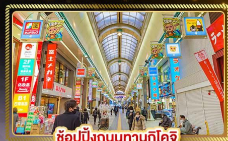
ช้อปปิ้งถนนทานุกิโจ