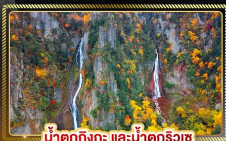
น้ำตกทิงกะ และน้ำตกริวซ