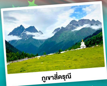
ภูเขาสิ่ดรุณี