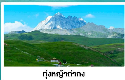
ทุ่งหญ้างาม