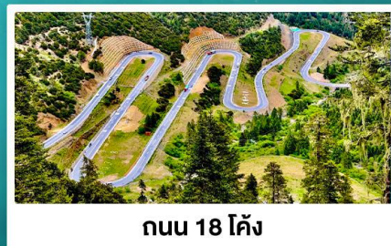
ถนน 18 โค้ง