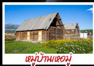
หมู่บ้านเหอมู่่