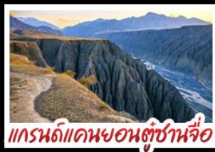
แกรนด์แคนยอนคู่ซันจื่อ

ทะเลสาบไซหลี่มู่ - คานาสี แกรนด์แคนยอนคู่ซันจื่อ ตลาดแกรนด์บาซาร์ - หมู่บ้านเหอมู่่