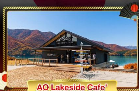
AO Lakeside Cafe'