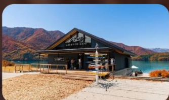
AO Lakeside Cafe'

HOTEL NARITA AREA หรือเทียบเท่ามาตรฐานญี่ปุ่น