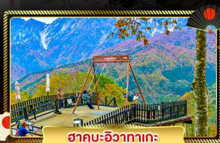
ฮาคุบะฮิวาตากะ