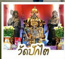
วัดปักโต