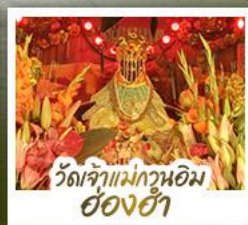
วัดเจ้าแม่กวนอิมฮ็องฮ่า