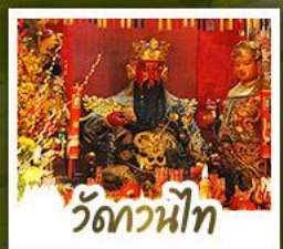
วัดทวนี่ไท