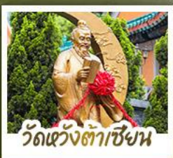
วัดเข่งต้าเซ็งแฉ