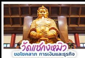
วัดชองกวงเมียว ขอโชคลาภ การเงินและธุรกิจ