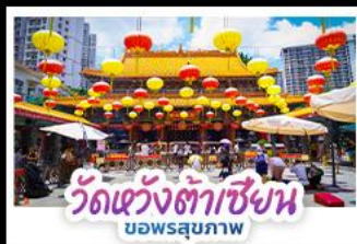
วัดวังต้าเซียน ขอพรสุขภาพ