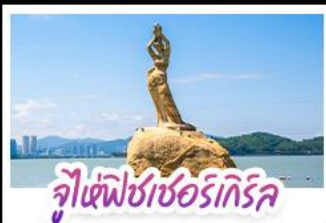
จุฬาลงกรณ์มหาวิทยาลัย