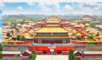
พระราชวังต้องห้ามปักกิ่ง

*ทางบริษัทฯ ขอสงวนสิทธิ์ในการสลับโปรแกรมทัวร์ตามความเหมาะสมขึ้นอยู่กับสถานการณ์หน้างาน โดยคำนึงถึงผลประโยชน์ของลูกค้าเป็นสำคัญ