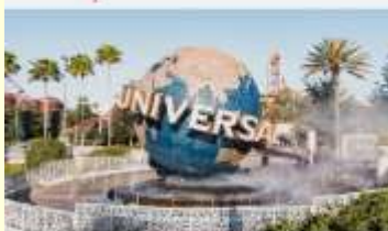
สวนสนุกยูนิเวอร์เซลปักกิ่งสตูดิโอ