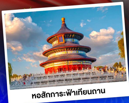
หอสักการะฟ้าเทียนถาน