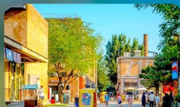
798 Art District