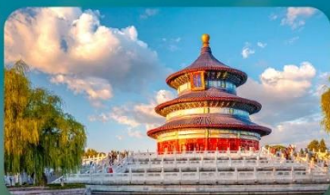
หอสักการะฟ้าเทียนถาน