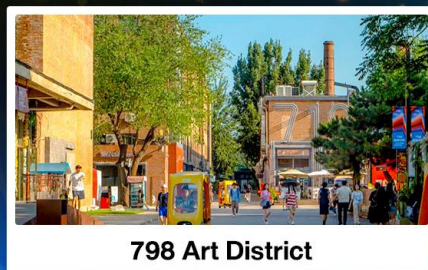
798 Art District