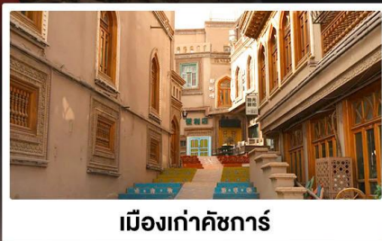
เมืองเก่าคัชการ