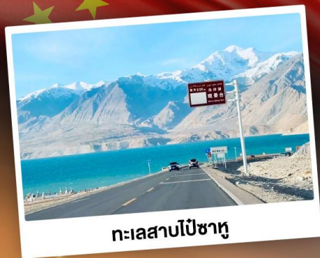
ทะเลสาบไปซาหู

“ซินเจียงใต้” ดินแดนแห่งทะเลทราย สัมผัสวัฒนธรรมของชาวซินเจียงอุยกูร์