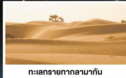
ทะเลทรายทากลามากัน