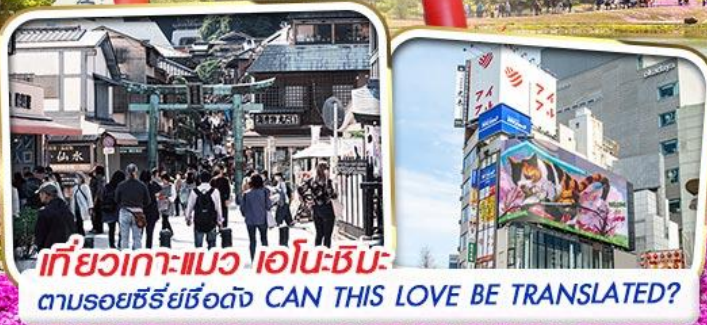
เที่ยวเกาะแมว เอโอโมะชิมะ ตามรอยซีรีส์ชื่อดัง CAN THIS LOVE BE TRANSLATED?