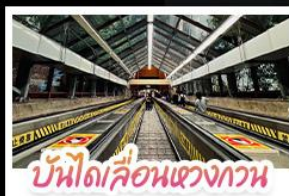
บันไดเลื่อนหวงกวน