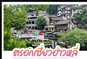
ตรอกเซียวฮ่าวเฉี