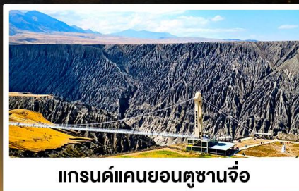
แกรนด์แคนยอนตูซานจื่อ