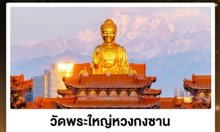
วัดพระใหญ่หวงกงซาน