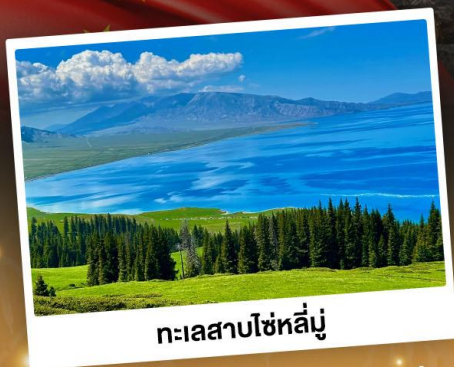
ทะเลสาบไซหลู่

ชมวิวสุดอลังการแบบยุโรปผสมเอเชีย กุ้งหลุ่ยานาราที้ ทะเลสาบสีเทอร์ควอยซ์