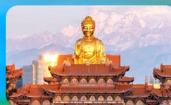
วัดพระใหญ่หวงกงชาน