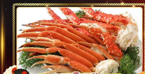
เมนูพิเศษ!! บุฟเฟ่ต์งาปูยักษ์ 3 ชนิด