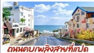
ถนนคอปเปิลิงสายที่เปิด