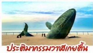
ประติมากรรมวาฬยักษ์ตีบ