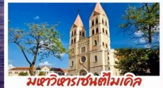
มหาวิหารเซนต์ไมเคิล