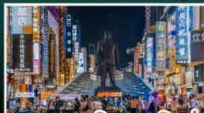
ถนนแดนแดนเซี่ยงซี