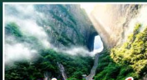
เขาประตูลสวรรค์