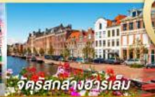
จัตุรัสกลางฮาร์เล็ม