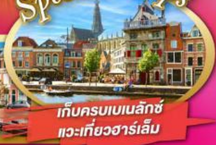
เก็บครบเบนลักซ์ แวะเที่ยวฮาร์เล็ม