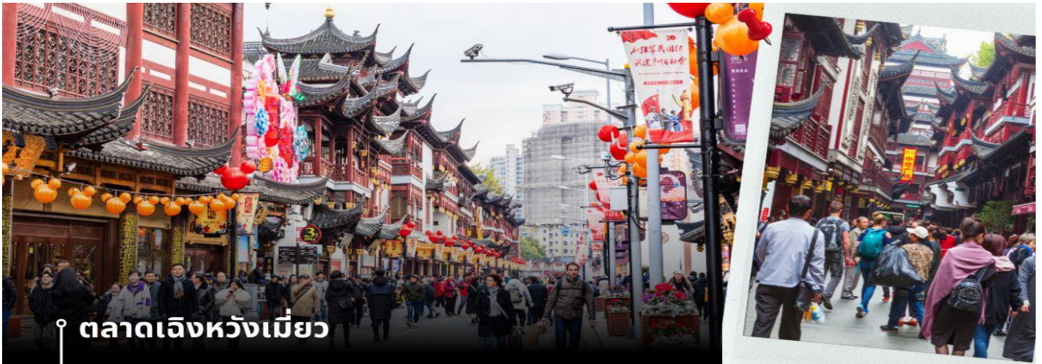
ตลาดเฉิงหวังเหมียว

จากนั้นนำท่านเดินทางสู่ย่าน Xin Tian Di (ซิน เทียน ดี) ย่านฮิปเตอร์ใจกลางนครเชียงใหม่ ที่วัยรุ่นต้องเช็คอิน จนกลายเป็นสถานที่ท่องเที่ยวติดอันดับต้นๆไปแล้ว สำหรับแหล่งช้อปปิ้งแห่งนี้ ไม่แพ้แหล่งช้อปปิ้ง อย่าง ถนนนาคนิง ถนนอยู่เจียง Yu Yuan Bazaar ถือว่าเป็นอีก 1 ไฮไลท์เด็ดของนครเชียงใหม่ก็ได้ เนื่องจากมีเอกลักษณ์ไม่เหมือนใคร สิ่งปลูกสร้างที่ใช้วัสดุบล็อก สถาปัตยกรรมแบบ Shikumen (ซิกเหมิน) การผสมผสานระหว่างสถาปัตยกรรมตะวันตก กับจีนเข้าด้วยกัน ทางเดินหิน กำแพงหิน ประติมากรรม บ้านเมืองเก่าแต่มีการดูแลรักษาอย่างดี เหมาะสำหรับมาเดินแบบ ฮิปๆชิวๆ นำท่านแวะช้อปปิ้ง ตลาดร้อยปีเฉิงหวังเหมียว หรือ ตลาดร้อยปีเชียงใหม่ เป็นตลาดเก่าของผู้ตั้ง เมืองเชียงใหม่ อาคารบ้านเรือนบริเวณนี้เป็นสถาปัตยกรรมโบราณสมัยราชวงศ์หมิงและราชวงศ์ชิง ตกแต่งสไตล์สถาปัตยกรรมแบบ โบราณจีน เก่าแก่กว่าร้อยปี ที่ยังคงความงดงาม ทั้งร้านขายอาหาร ร้านขนมพื้นเมืองอาหารขึ้นชื่อของที่นี่คือ เสี่ยวหลงเปา อันลือชื่อ และยังมีขายของที่ระลึกต่างๆมากมาย