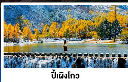
ปี้ฝิงโกว