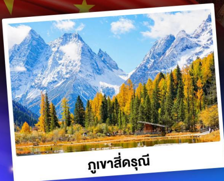
กุเขาสีดรุณี