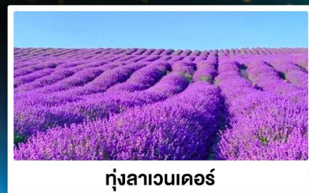
ทุ่งลาเวนเดอร์