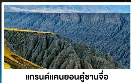
แกรนด์แคนยอนคู่ชานจื่อ