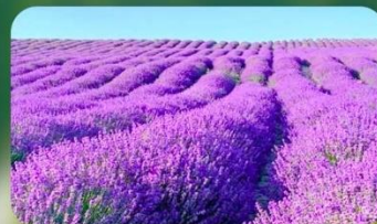
ทุ่งลาเวนเดอร์