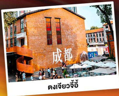
ตงเจียวจี้

เทือกเขาแอลป์แห่งเมืองจีน ชมความงามของ "อุทยานภูเขาสิ่วตุนี"