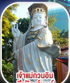
เจ้าแม่กวนอิม รีฟลัสส์เบย์