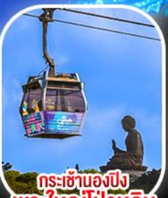
กระเช้าเองปีง พระใหญ่ไผ่หลิน