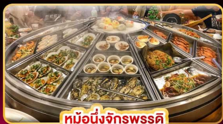
หม้อหนึ่งจักรพรรดิ