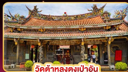
วัดต้าหลงตงเปาอัน