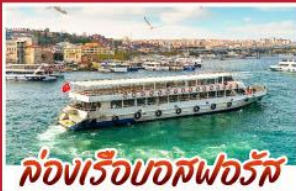
ล่องเรือบอสฟอรัส