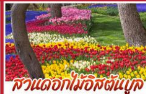
สวนดอกไม้มิอัสตันบุค