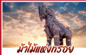
ม้าไม้แห่งทรอย