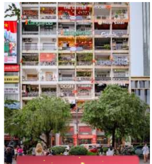
The Cafe Apartment.

ที่พัก Sai Gon Emerald ระดับ 4 ดาวท้องถิ่นหรือเทียบเท่า