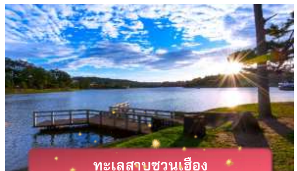
ทะเลสาบชวนเอื้อง

ที่พัก The Western Hill ระดับ 4 ดาวหรือเทียบเท่า