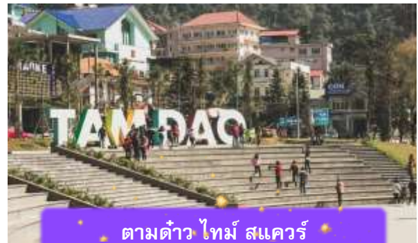
ตามด้าว ไทม์ สแควร์

เช็คอิน ตามด้าว ไทม์ สแควร์ ที่นี่เป็นพลาซ่าสาธารณะกลางเมือง เป็นพื้นที่ที่ชาวตามด้าวใช้พักผ่อนกันเป็นลานน้ำพุกว้าง ๆ ที่มองเห็นเมืองโดยรอบ ซึ่งรอบๆจัตุรัสนี้ก็จะมีร้านค้า คาเฟ่ ร้านอาหาร และมีมุมถ่ายรูปน่ารักๆ เหมาะสำหรับการถ่ายรูป นำท่านเดินทางกลับ เมืองฮานอย