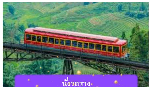
นั่งรถราง

เที่ยง บริการอาหารกลางวัน ณ ภัตตาคาร พิเศษ ... เมนูบุฟเฟ่ต์ฟานซีปัน