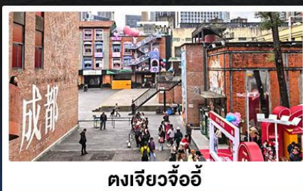
ตงเจียวจ้ออี้