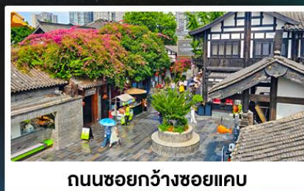
ถนนชอยกว้างชอยแคว