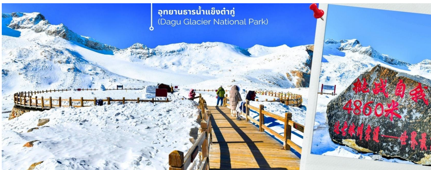
ความหนาวของหิมะขึ้นอยู่กับสภาพอากาศ

จากนั้นนำท่านเดินทางสู่ เมืองเฮยส่วย (ใช้เวลาเดินทางประมาณ 2 ชั่วโมง)เพื่อเดินทางไปยัง อุทยานธารน้ำแข็งต้ากู่ (รวมกระเช้าขึ้นลง) ต้ากู่ปิงชวณ หรือ Dagu Glacier National Park เป็นธารน้ำแข็งกลางเขี้ยวที่สวยงามที่สุดแห่งหนึ่งของโลกและเป็นสถานที่ท่องเที่ยวระดับ 4A ของจีน ตั้งอยู่ที่เมืองเฮยส่วย ในมณฑลเสฉวน ห่างจากเมืองเฉิงตู ประมาณ 300 กิโลเมตร ถือเป็นธารน้ำแข็งที่อายุน้อยที่สุด ที่ตั้งอยู่ในระดับความสูงที่ต่ำที่สุดและอยู่ใกล้กับเมืองมากที่สุด ในบรรดาธารน้ำแข็งทั้งหมด โดยอยู่สูงจากระดับน้ำทะเลประมาณ 3,800-5,100 เมตร จุดสูงที่สุดที่นักท่องเที่ยวสามารถขึ้นไปได้จะอยู่ที่ 4,860 เมตร