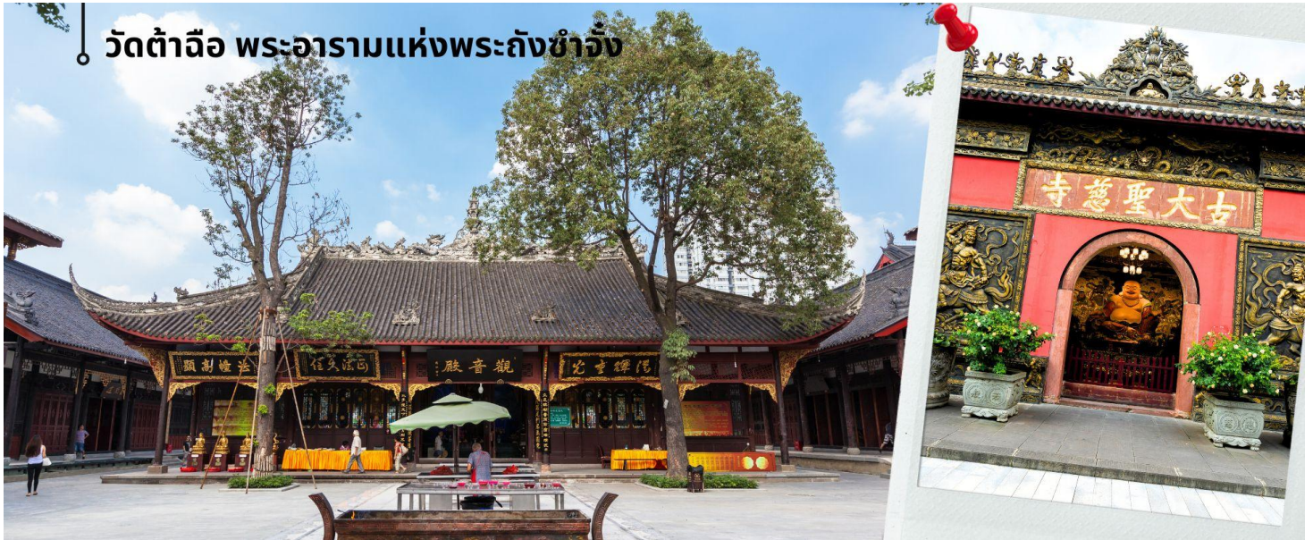
วัดต้าฉือ พระอารามแห่งพระถังซำจั๋ง

เดินทางกลับเฉิงตูชม วัดต้าฉือ พระอารามแห่งพระถังซำจั๋ง ใจกลางนครเฉิงตู พระถังซำจั๋ง ได้รับการสรรเสริญว่าเป็นผู้มีความเพียร และมีชื่อเสียงมายาวนานกว่า 1,400 ปี และยังได้รับการยกย่องว่าเป็น พระไตรปิฎกแห่งราชวงศ์ถัง พุทธประวัติของพระถังซำจั๋งถูกจารึกในสถานที่ต่างๆมากมาย รวมไปถึงได้ถูกกล่าวถึงในจดหมายเหตุหลายเล่มตามเส้นทางการเดินทางแห่งความเพียรของท่าน รวมทั้งมีพระอัฐิของท่าน ประดิษฐานอยู่ในพระอารามของนครนานจิง และที่ทะเลสาบสุริยันจันทราเป็นเกาะใต้หวั่นอีกด้วย