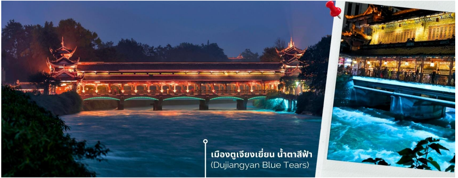
เมืองตูเจียงเยียน น้ำตาสีฟ้า (Dujiangyan Blue Tears)