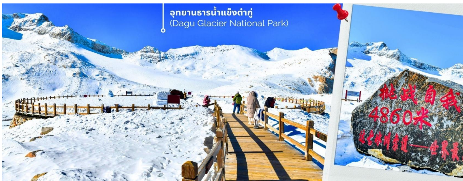
การตกและความหนาวของหิมะขึ้นอยู่กับสภาพอากาศ

จากนั้นนำท่านเดินทางสู่ เมืองเฮยฮุย (ใช้เวลาเดินทางประมาณ 2 ชั่วโมง) เพื่อเดินทางไปยัง อุทยานธารน้ำแข็งต้ากู่ปิงชวณ(รวมกระเช้าขึ้นลง) ต้ากู่ปิงชวณ หรือ Dagu Glacier National Park เป็นธารน้ำแข็งกลาเซียร์ที่สวยงามที่สุดแห่งหนึ่งของโลก และเป็นสถานที่ท่องเที่ยวระดับ 4A ของจีน ตั้งอยู่ที่เมืองเฮยฮุย ในมณฑลเสฉวน ห่างจากเมืองเฉิงตูประมาณ 300 กิโลเมตร ถือเป็นธารน้ำแข็งที่อายุน้อยที่สุด ที่ตั้งอยู่ในระดับความสูงที่ต่ำที่สุด และอยู่ใกล้กับเมืองมากที่สุดในบรรดาธารน้ำแข็งทั้งหมด โดยอยู่สูงจากระดับน้ำทะเลประมาณ 3,800-5,100 เมตร จุดสูงที่สุดที่นักท่องเที่ยวสามารถขึ้นไปได้จะอยู่ที่ 4,860 เมตร