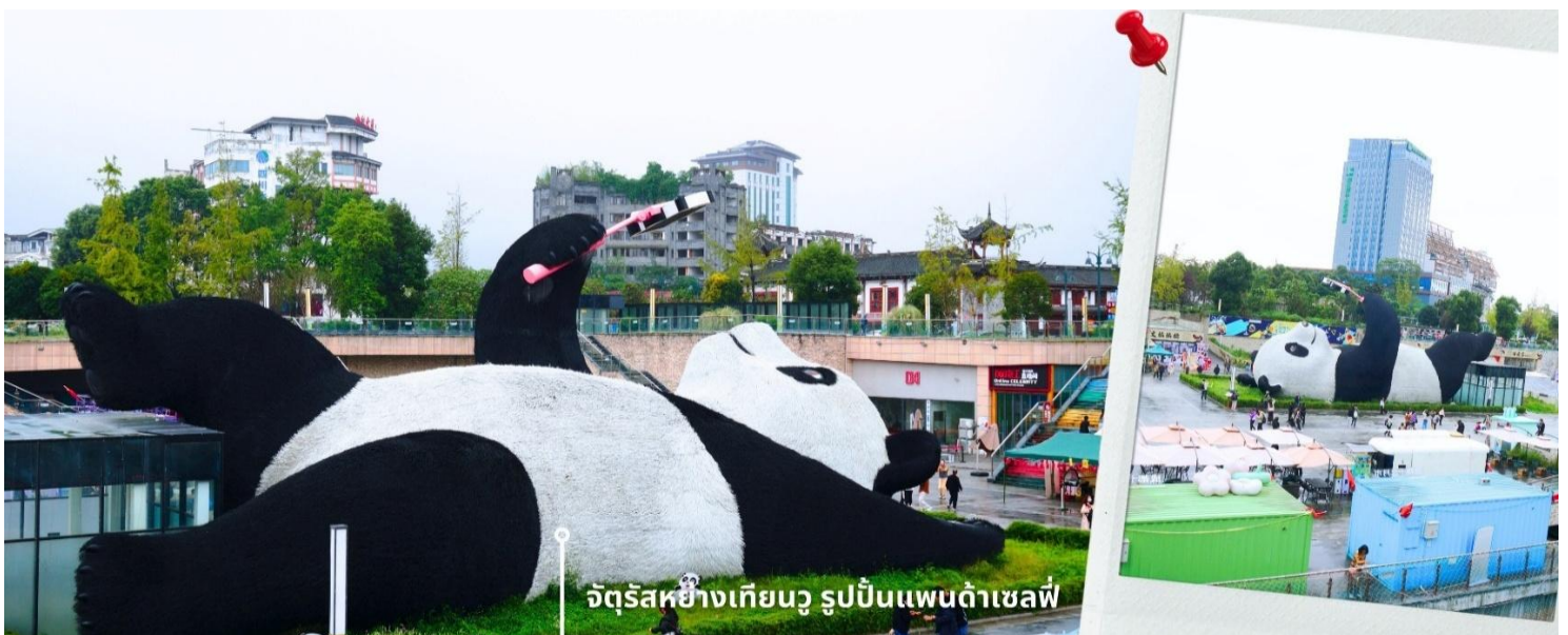
จัตุรัสหยางเทียนวู รูปปั้นแพนด้าเซลฟี่

นำท่านเที่ยวชม จัตุรัสหยางเทียนวู เป็นจุดเช็คอินที่สำคัญสำหรับคนที่มาเที่ยวที่ เมืองตูเจียงเยียน บริเวณจุดท่าข้าม อำเภอตูเจียงเยียน นครเฉิงตู ไฮไลท์ของจัตุรัสหยางเทียนวู คือ ประติมากรรม แพนด้ายักษ์ ที่กำลังนอนหงายท้อง ยื่นมือถือไม้เซลฟี่สีชมพู ซึ่งออกแบบโดยนักออกแบบชื่อดัง Florentijn Hofman รูปปั้นแพนด้า ยักษ์มีความยาว 26 เมตร กว้าง 11 เมตร สูง 12 เมตร และหนัก 130 ตัน แบบท่าทางสบายๆของแพนด้าที่สร้างความประทับใจและ รอยยิ้มให้กับผู้ที่มาเยือนจัตุรัสหยางเทียนวู สามารถดึงดูดนักท่องเที่ยวได้เป็นจำนวนมากเลยทีเดียว เป็นการ แสดงออกด้วยภาษาทางศิลปะแบบหนึ่งที่สะท้อนชีวิตในท้องถิ่น มอบความรู้สึกสนิทสนมและมีความสุขกับผู้ชม อิสระเดินชมถ่ายภาพ รูปปั้นแพนด้าเซลฟี่ ตามอัธยาศัย ที่นี่เป็นจุดเช็คอินที่เหมาะสมสำหรับทุกเพศทุกวัย หากคุณ กำลังมองหาสถานที่ท่องเที่ยวใหม่ๆ ที่เต็มไปด้วย ความทรงจำดีๆ จัตุรัสหยางเทียนวู คือคำตอบที่สมบูรณ์แบบ