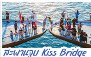
สะพานจูบ Kiss Bridge