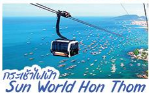
กระเช้าไฟฟ้า Sun World Hon Thom