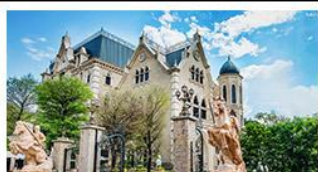
NINA CHOCOLATE CASTLE

ทะเลสาบสุริยจันทรา - ไทเป 101 จิวเฟิ่น - NINA CHOCOLATE CASTLE MONSTER VILLAGE - ชิหมินตง เมนูพิเศษ ปลาประรานาธิบติ เซี่ยวหลงเป่า / ซาปู้ไต่หวั่น